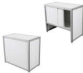
Art. 42295 Counter weiß, abschließbar