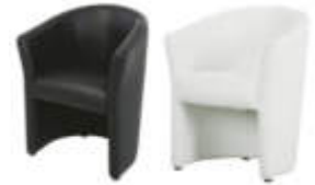
Art. 15000/15100 Clubsessel schwarz oder weiß