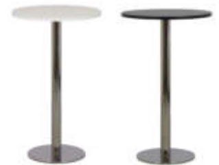
Art. 29405/29410 Stehtisch INOX weiß oder schwarz

optional mit Husse farbig (Art Nr 29019):