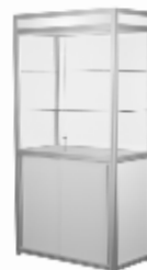
Art. 50121a Hochvitrine H 200 beleuchtet