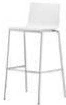
Art. 16680 Barhocker Kuadra weiß