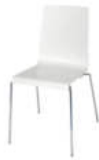
Art. 12680 Stuhl Kuadra