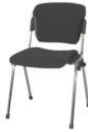
Art. 10261 Stuhl FLOU, Polster anthrazit