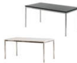
Art. 21040/21042 Besprechungstisch ws oder sw 160x80