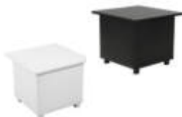
Art. 15680/15681 Tischkubus weiß oder schwarz 55x55x45