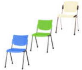
Art. 10266 / 10267 / 10295 / Stuhl FLOU, COLOR blau/grün/gelb