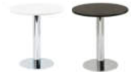
Art. 26000/26010 Bistrotisch chrom /ws oder sw