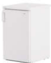
Art. 60300 Kühlschrank