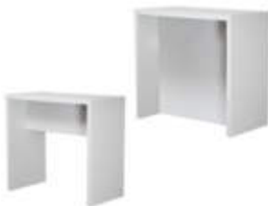
Art. 29024/ 29027 Brückentischstehtisch 120x70 / BT mit Blende