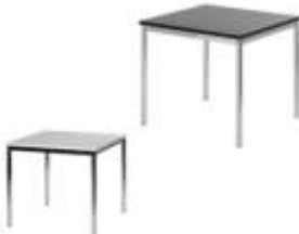
Art. 21001/21002 Besprechungstisch ws oder sw 80x80