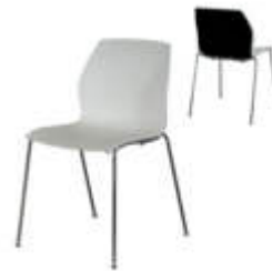
Art. 12112/12113/12116 Stuhl Kalea weiß/sw./rot/grün