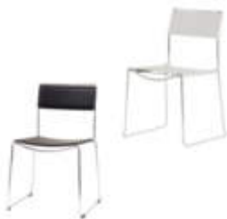
Art. 13200/13202 Stuhl Jonel schwarz/- weiß