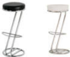
Art. 16100/16101 Barhocker Z schwarz oder weiß