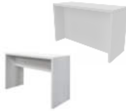
Art. 29034/29037 Brückentischstehtisch 180x70 / BT mit Blende