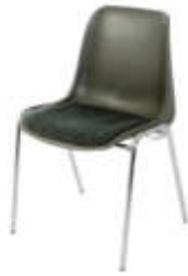
Art. 10130 Schalenpolsterstuhl