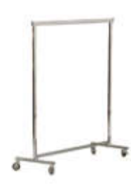
Art. 30006 Konfektionsständer chrom