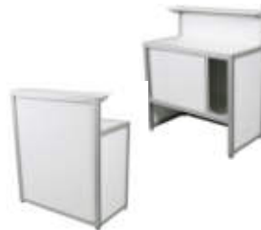
Art. 42305 Counter weiß mit Aufsatz, abschließbar