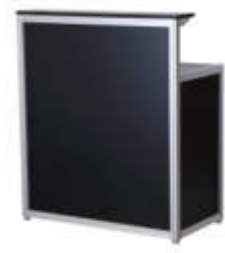
Art. 42307 Counter schwarz mit Aufsatz, begrenzte Stückzahl abschließbar