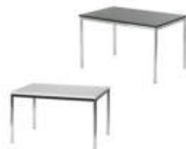
Art. 21021/21022 Besprechungstisch weiß o. schwarz 120x80