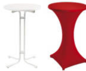
Art. 29010 Stehtisch weiß, klappbar

optional mit Husse farbig (Art Nr 29019):