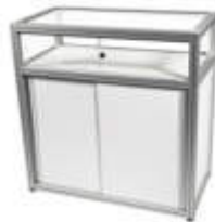
Art. 50111 Tischvitrine Maxima