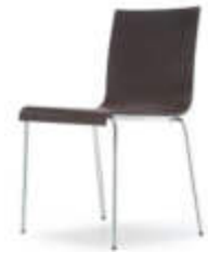
Art. 12685 Stuhl Kuadra Wenge